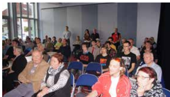
Krajská filmová soutěž Český videosalon