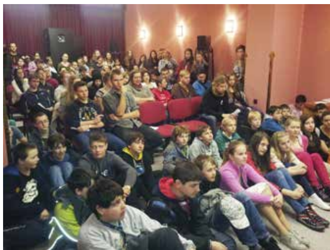
Filmová přehlídka náchodská Prima sezóna

Filmaři využívali tradičně možnosti poradenství a technické výpomoci videostudia formou konzultací či zapůjčení techniky. V prostorách studia našli zázemí členové Klubu filmové tvorby, seminaristé Školy AVT a vybavení pro záznam posloužilo i k průběhu praktického dvoudenního filmového semináře konaného pro studenty Gymnázia v Moravské Třebové či pro praktický seminář žurnalistiky pro Gymnázium J.K. Tyla v Hradci Králové.